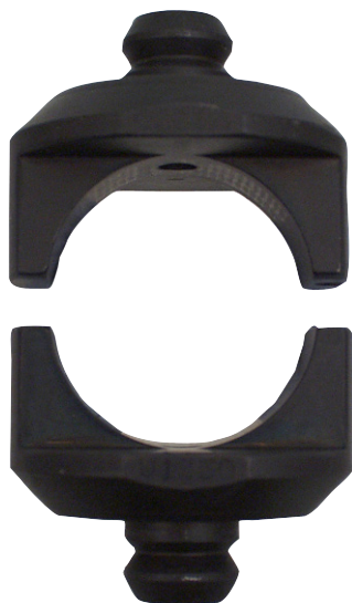
Bakkeholder V1330 (sæt).