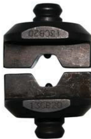
Integreret bakker 13CB20.